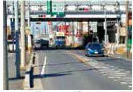
交差点右折避讓帯設置工事が 秋頃に完成予定です。