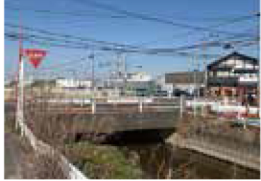
橋梁架換のための修正設計等