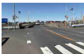
橋梁整備・架換のための予備修正 設計