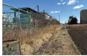
鉄塔移設計の負担金 用地買収 物件補償等