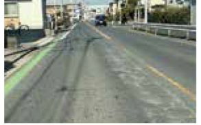
道路舗装修繕 早稲田4丁目~6丁目付近