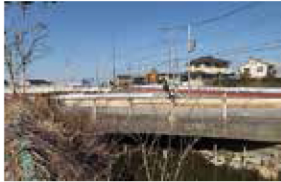
旧橋梁の撤去工事への負担金