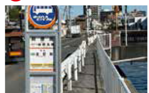
歩道整備工事 幸房付近