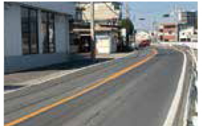
道路舗装修繕 幸房付近