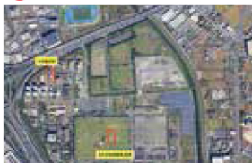
下水道処理施設の改築工事、 諸計画策定・計画変更等