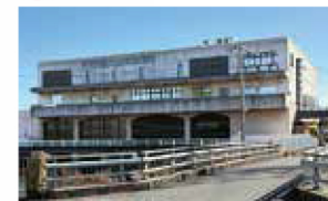
電気設備更新工事、耐水化設計、 除塵設備更新工事等