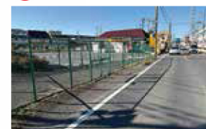
歩道設置のための用地買収・物件 補償等 谷中付近