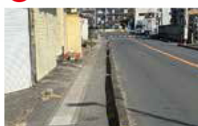
歩道再整備のための設計