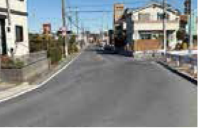
市道へ移管するための道路 台帳整備、修繕工事等