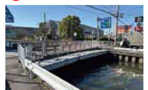
橋梁架換のための修正設計等