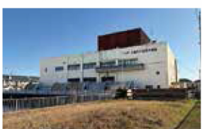
主ポンプ・減速機分解整備工事、 ポンプ設備更新工事