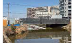
橋梁架換のための修正設計等