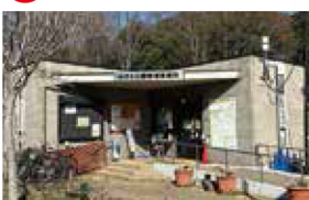
園路灯修繕、管理事務所・管理事務所前トイレ更新工事