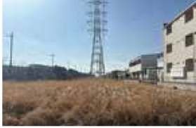
橋台工事、軟弱地盤対策設計、鉄塔移設計等