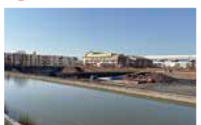
栄調節池整備工事