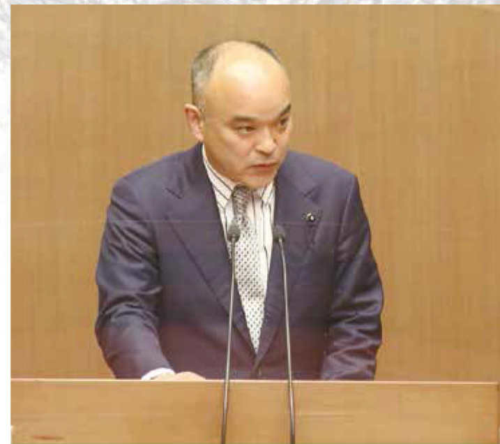
令和5年度一般会計当初予算

県議会2月定例会では、表題の通り令和5年度一般会計当初予算(案)について審議しました。長引くコロナ禍に加え、昨年からのロシアによるウクライナ侵攻や円安などによる原油価格・物価高騰は、私たち県民の生活に大きな影響をもたらしています。当初予算では、「ポストコロナ元年」を理念として、DX(デジタルトランスフォーメーション)のさらなる推進や中小企業の事業再構築に対する支援強化などが盛り込まれました。県の持続可能な発展につなげていく施策となっております。