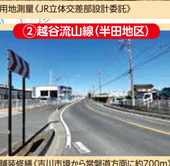
② 越谷流山線(半田地区)