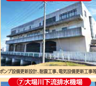
⑦ 大場川下流排水機場