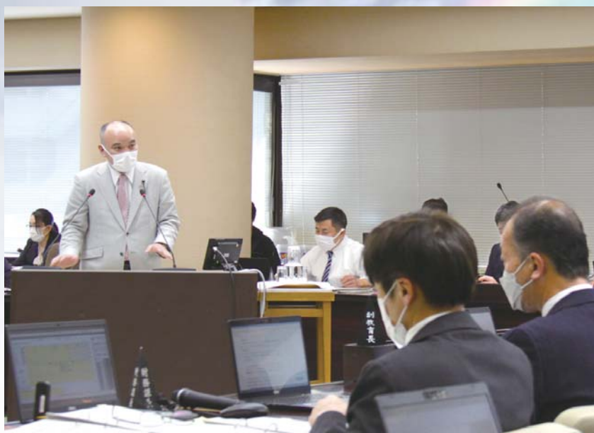
県議会2月定例会では予算特別委員会委員として部局別質疑を行いました。

令和3年度2月定例会が2月17日～3月25日に行われました。表題のように過去最大の一般会計予算となりましたが、本定例会では、予算特別委員会委員として部局別質疑を行いました。主な質疑事項は、SDGsの推進、移住人口の誘導、川の保全対策、保育所待機児童対策、保育士の処遇改善、要配慮者等の災害時支援体制、若年がん患者の支援、オンライン授業における教員の指導力向上、特別支援学校分校整備の関連事業について各部長へ質しました。特に保育士の処遇改善については、東京都・千葉県と本県の給与格差を鋭く指摘し、附帯決議※に持ち込みました。