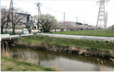
都市軸道路予定地内の第二大場川に架かる橋梁の設計