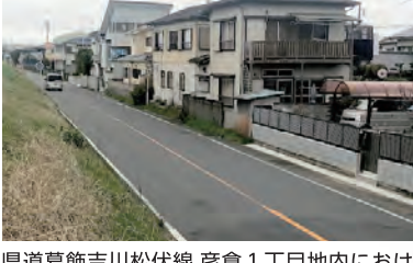
県道葛飾吉川松伏線 彦倉1丁目地内における舗装の修繕工事 800m