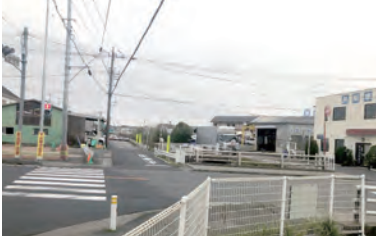
駒形新橋架け換えに伴う橋梁の設計、第二大場川の川幅を広げるための用地買収・護岸工事