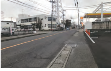
県道上笹塚谷口線 谷口地内における舗装の修繕工事 500m