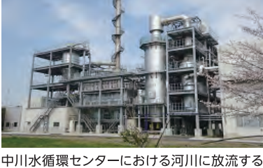
中川水循環センターにおける河川に放流する処理水の水质監視装置の設置、下水に流れ込むごみを除去する装置の設置など