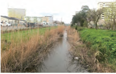
第二大場川 采女地内の樹木伐採・土砂の撤去