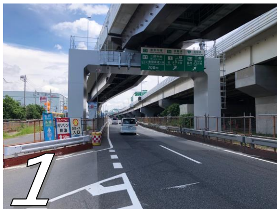
1 国道298号「三郷 IC 出口西」交差点を南下すると、昭和シェル石油手前に首都高、常磐道、外環道入口の標識があります。