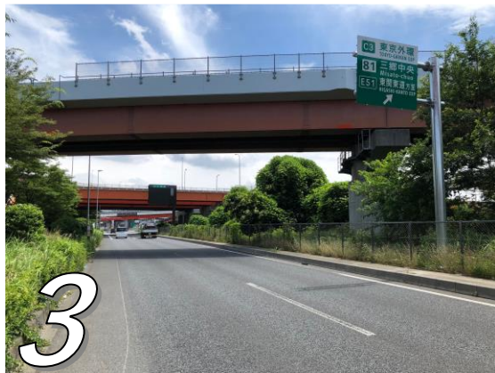
3 首都高、常磐道入口を通過し、500m程直進すると外環三郷中央入口となります。