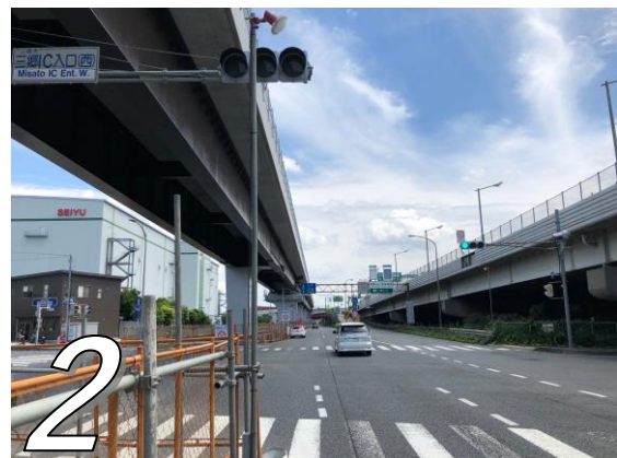
2 次の交差点「三郷 IC 入口西」交差点を過ぎると既存の首都高、常磐道の入口があります。